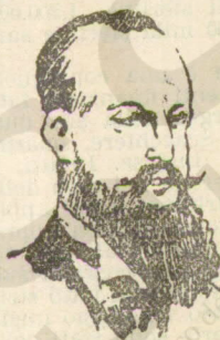
Figura di vero gentiluomo dai modi distinti e dalla schietta cortesia che è indice di bontà, saprà certamente farsi, in Senato, lo stesso ambiente di simpatia che si era fatto a Montecitorio.